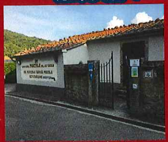
アグリツーリズモ ボルゴ モカレ