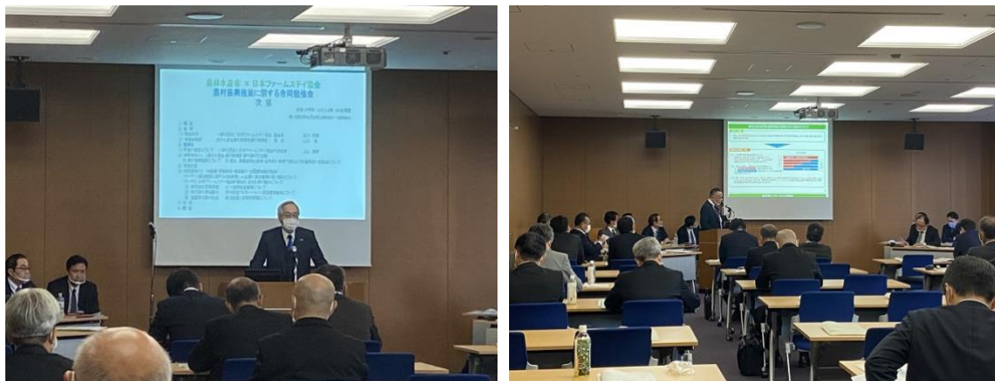
合同勉強会の様子

オンライン配信につきましては、音声聞き取りにくい、資料が見つらい等、多くのご不便をお掛けすることとなり、誠に申し訳ございませんでした。今回の問題点を改善し、今後も様々な研修等を配信したいと考えておりますので、ぜひ本会の取り組みをご活用ください。