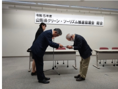
山形新聞 令和5年6月6日記事 PDF(443KB)

https://jpcsa.org/wp/wp-content/uploads/2023/06/jpcsavol157_7.pdf