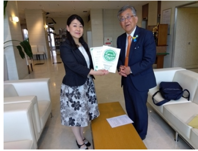
人吉新聞 令和5年5月24日記事 PDF(367KB)

https://jpcsa.org/wp/wp-content/uploads/2023/06/jpcsavol157_4.pdf